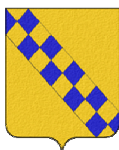
Mairie de BARON 30700