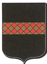
Mairie de AIGALIERS 30700

Cette réunion sera animée par La Direction Départementale des Territoires et de la Mer et le Service Départemental d'Incendie et de Secours du Gard