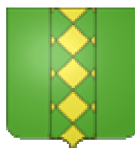
Mairie de FOISSAC 30700