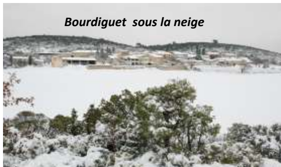
Bourdiguët sous la neige