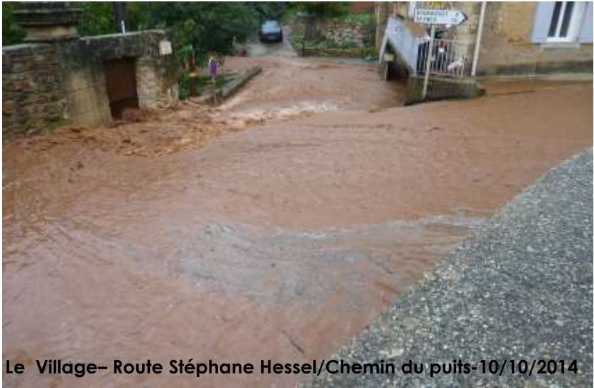
Le Village- Route Stéphane Hessel/Chemin du puits-10/10/2014