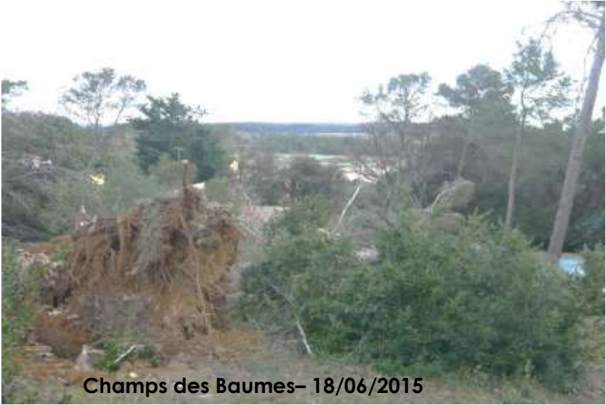
Champs des Baumes- 18/06/2015